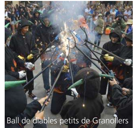
Ball de diables petits de Granollers