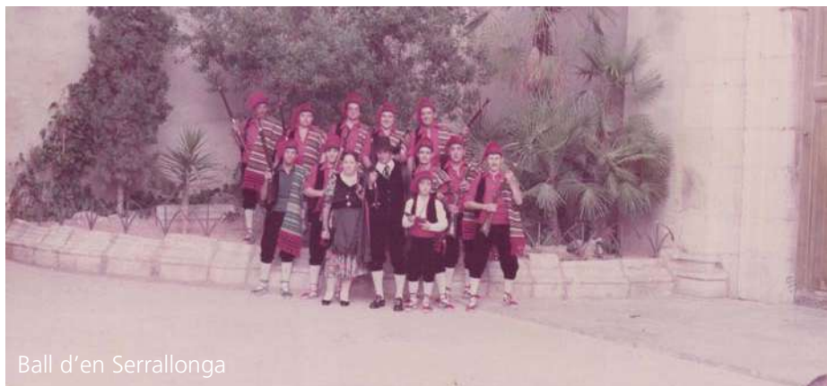
Ball d'en Serrallonga