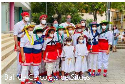
Ball de Cercolets de Sitges