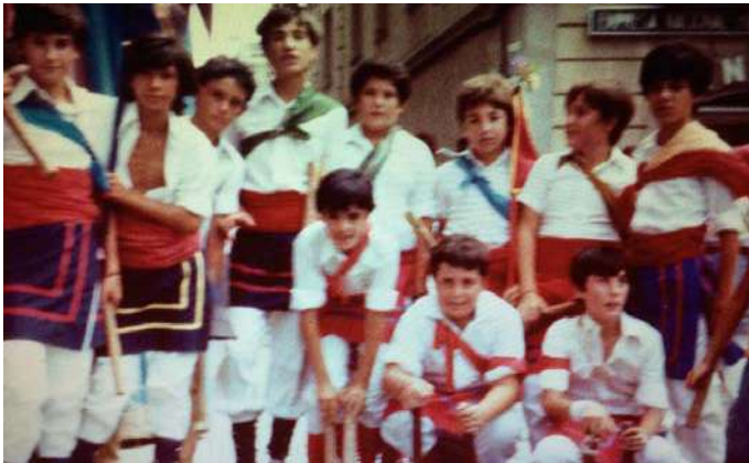
BALL DE BASTONS NOIS