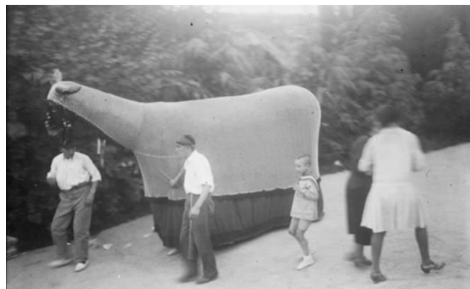
MULASSES LA BOJA, LA PRESUMIDA I LA CABRETA