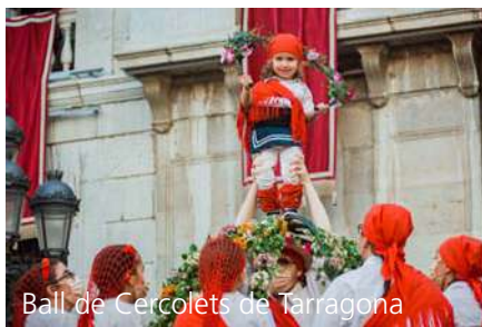
Ball de Cercolets de Tarragona