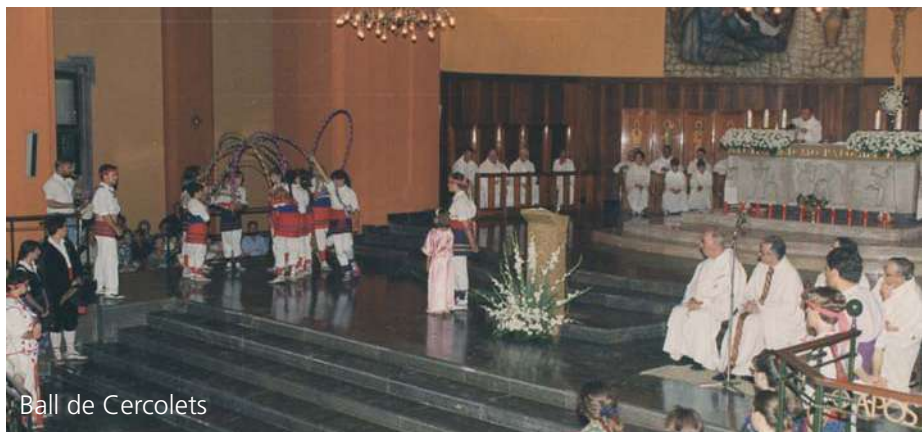
Ball de Cercolets