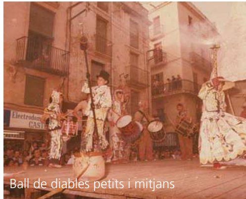
Ball de diables petits i mitjans