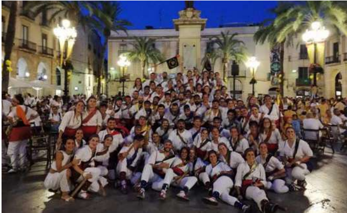
BALL DE BASTONS NOIES