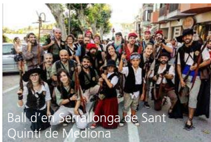
Ball d'en Serrallonga de Sant Quintí de Mediona