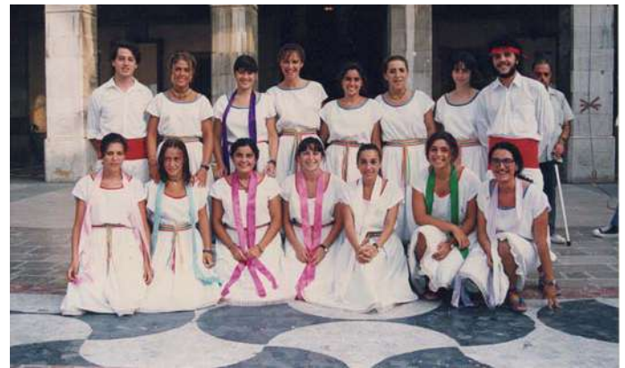
BALL DE CINTES