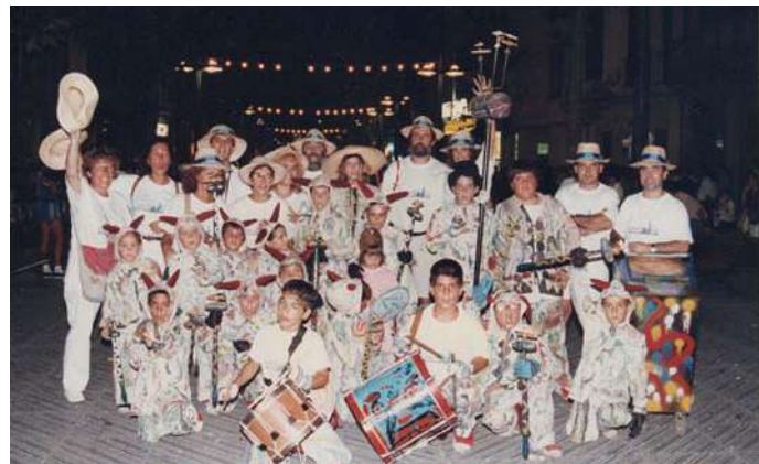
BALL DE DIABLES PETITS I MITJANS