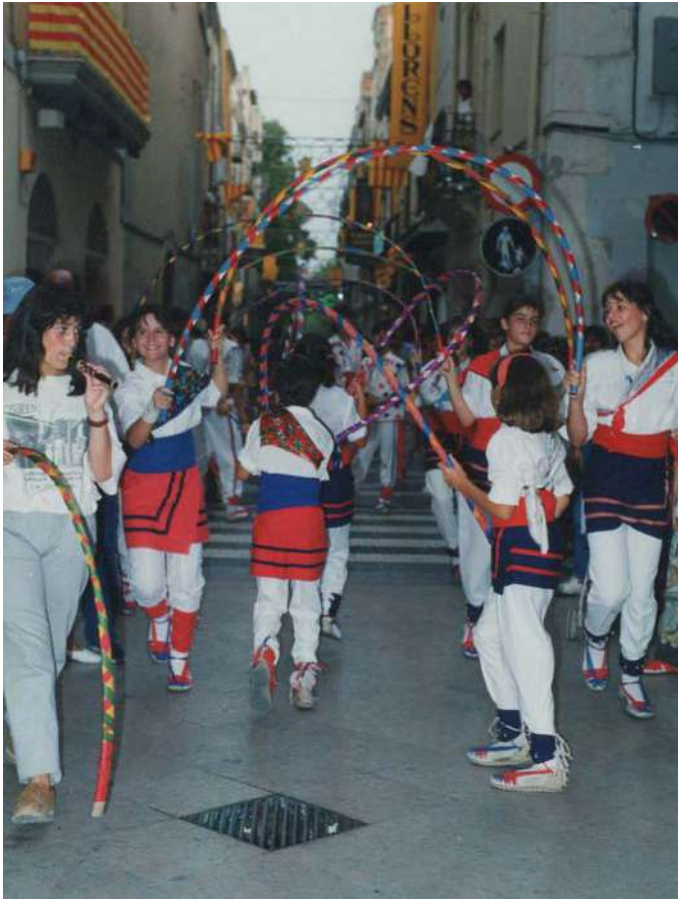
BALL DE CERCOLETS