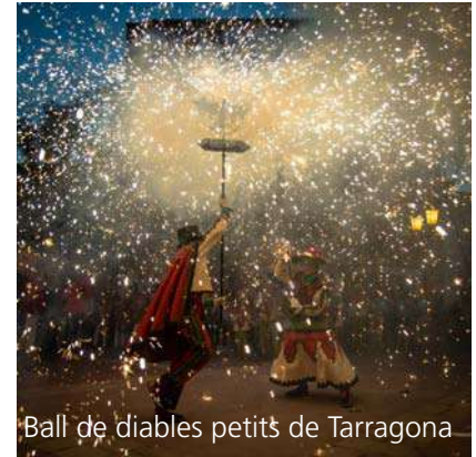
Ball de diables petits de Tarragona