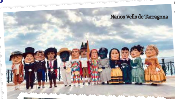
Nanos Vells de Tarragona

El 1949 el Foment Vilanoví gràcies a un romanent de diners de l'estrena del gegants decideix posar al carrer uns nous nans, que van sortir fins al 1962, mes tard el 1981 de la mà de la societat l'Acord es tornen a recuperar els Nans, i el 1989 passen a formar part de l'Agrupació de Balls Populars, actualment son 16 nans, 8 parelles que responen als següents noms: els Macers, el Pescador i la Remendadora, els Cubanos, els Nens, els Catalans, el Manyo i la Gitana, el Gepeto i la Mary Poppins, el Botiguer i la Remei i els Tothosap.