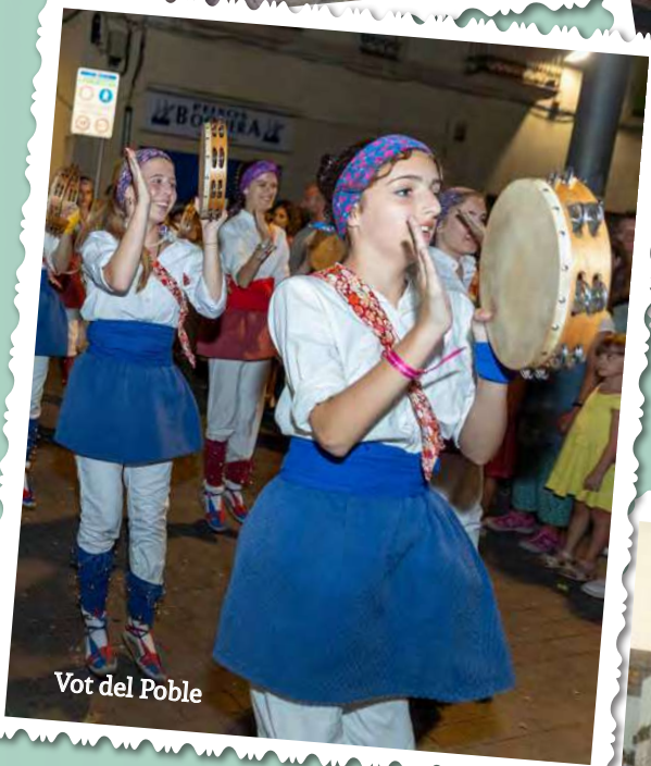
Vot del Poble