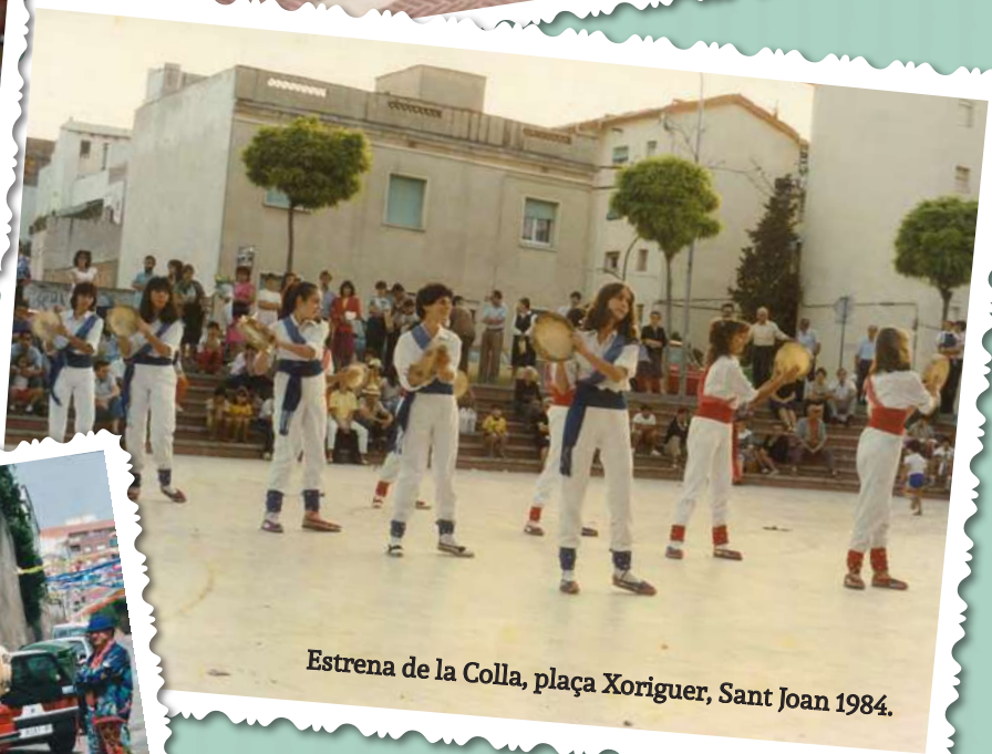
Estrena de la Colla, plaça Xoriguer, Sant Joan 1984.