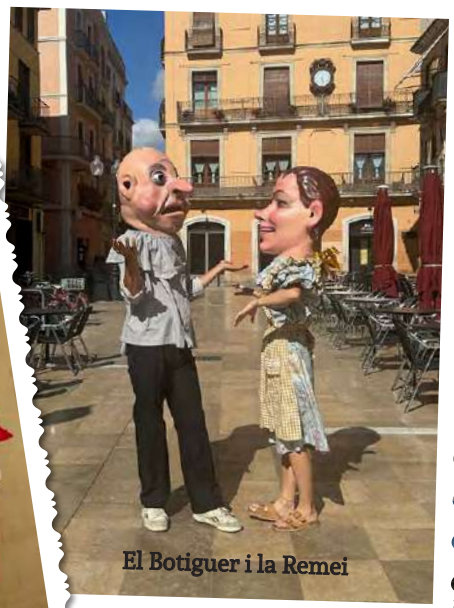
El Botiguer i la Remei