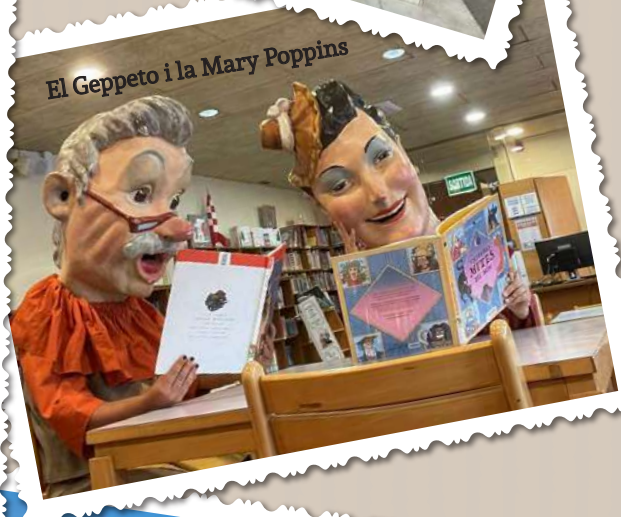
El Geppeto i la Mary Poppins