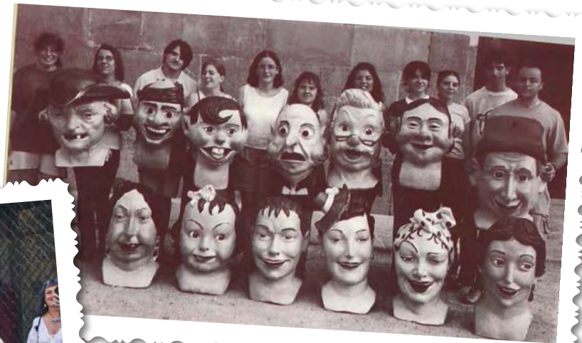
Ball de Nans, 1999.