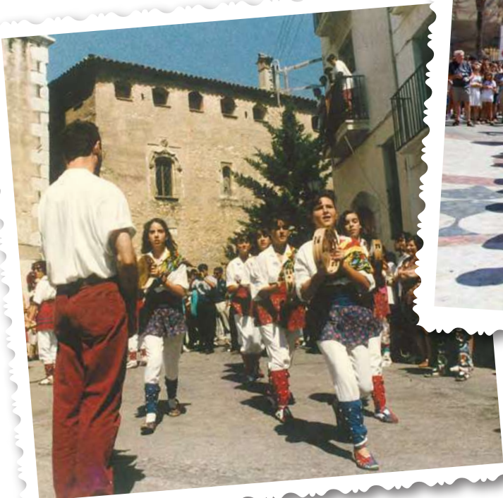
Festa Major de La Geltrú, 1989.