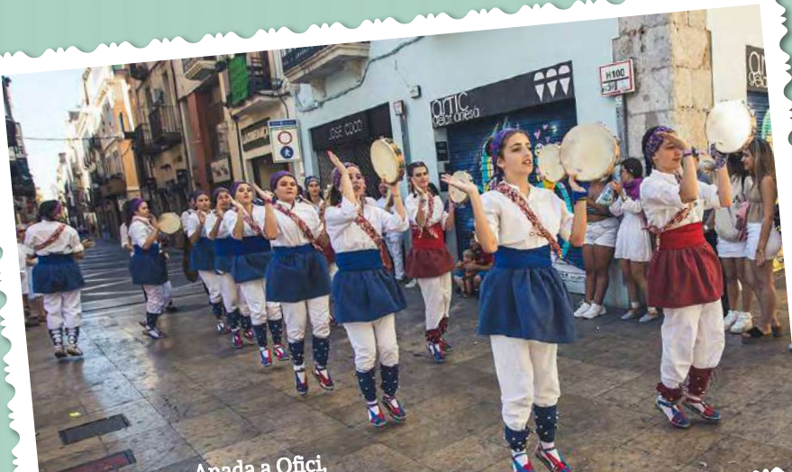
Anada a Ofici, Festa Major 2023