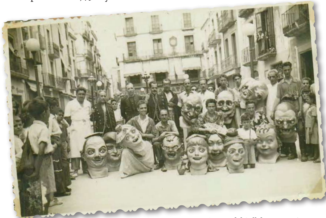
Estrena del Ball de Nans, 1949.

Us hi esperem a tots, 75 anys s'ho mereixen!