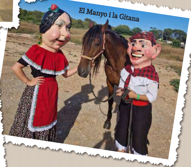
El Manyo i la Gitana