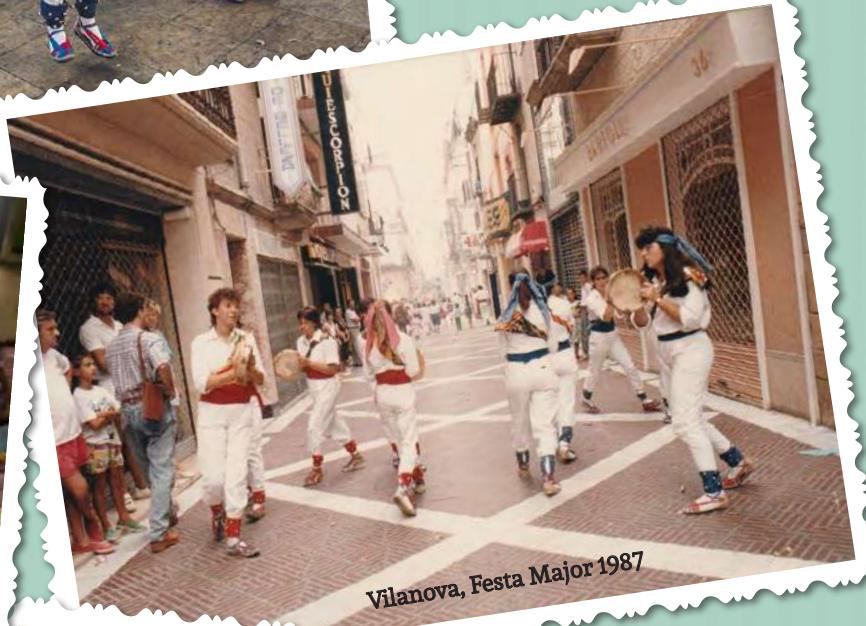
Vilanova, Festa Major 1987