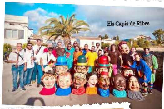
Els Capis de Ribes