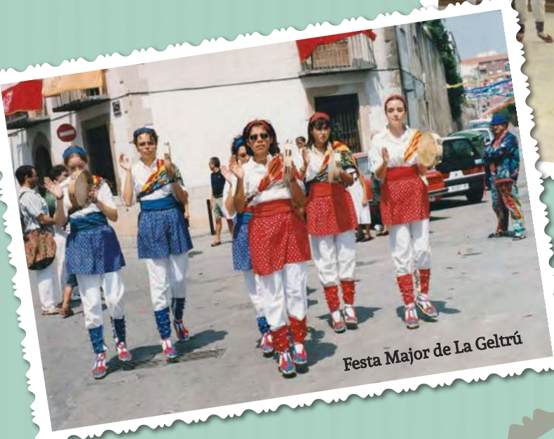
Festa Major de La Geltrú