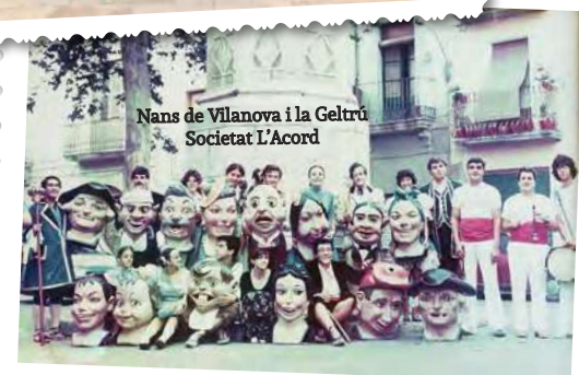
Nans de Vilanova i la Geltrú Societat l'Acord