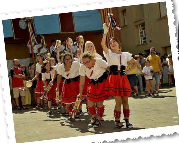
Ball De Panderetes de Sant Quintí de Mediona

Sembla que fos ahir i ja han passat quaranta anys, des que un grup de noies de l'Agrupació de Balls Populars, van sortir a fer per primer cop a Vilanova, el Ball de Panderos, els hi va ensenyar una noia de Vilafranca i des d'aleshores amb petites variants i canvis de vestuari han estat presents a les nostres festes populars. Per celebrar-ho ha convidat a quatre colles de Catalunya i del País Valencià que venen a celebrar-ho amb nosaltres.