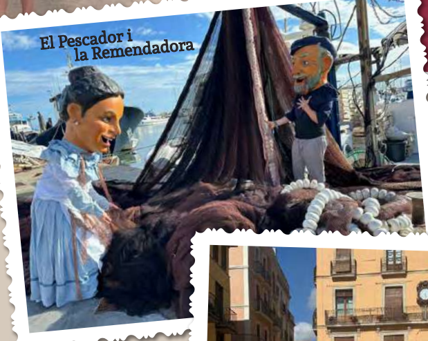
El Pescador i la Remendadora