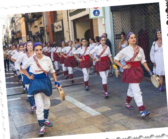
Festa Major, 2023