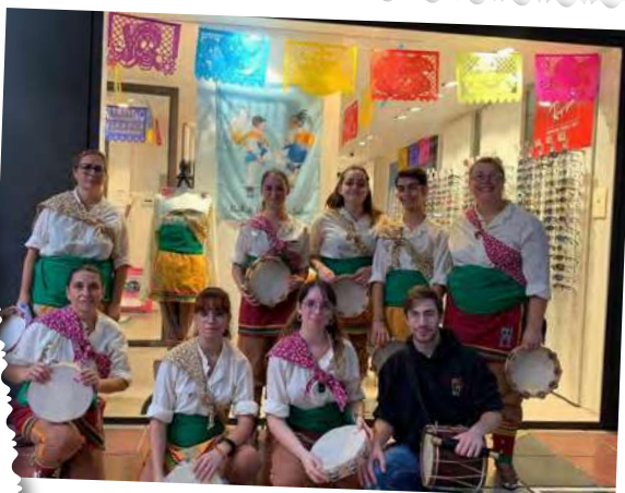
Ball de Panderos de Salou