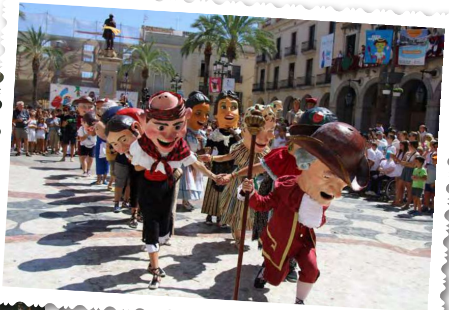
Ball de Nans, plaça de la Vila.