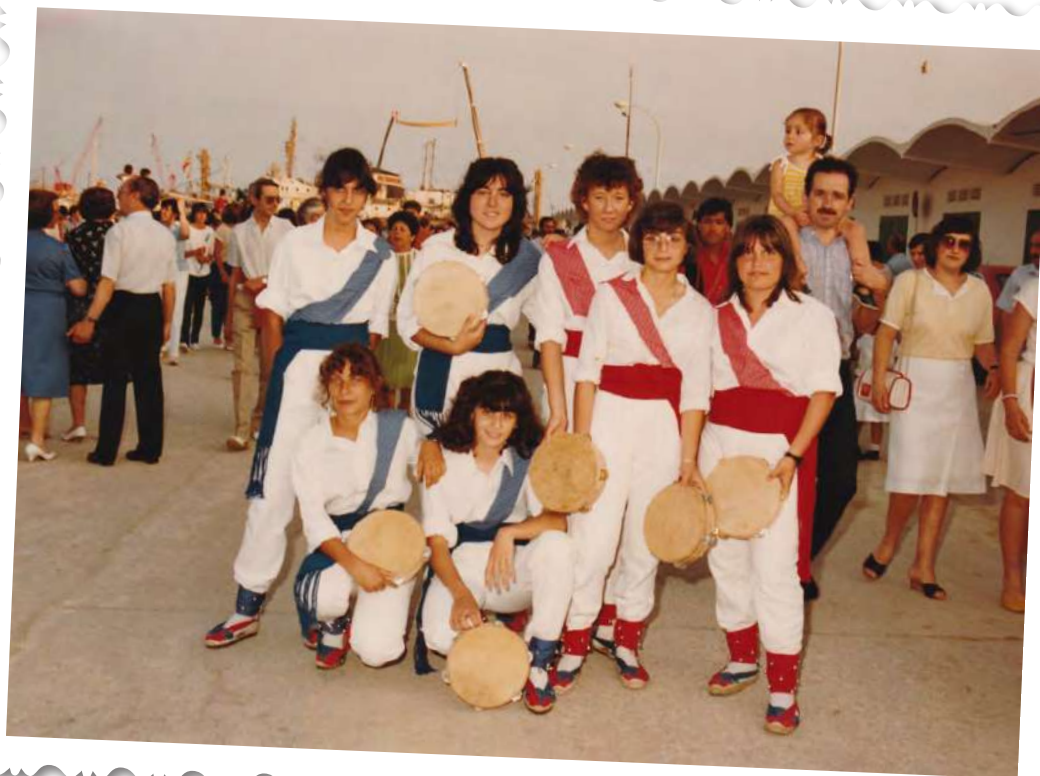
Ball de Panderos 1984

Han passat 40 anys, i aquesta festa major volem celebrar-ho amb una cercavila de balls de panderos, hem convidat el ball de panderos de Salou, el ball de panderos de Sant Quintí de Mediona i el ball de panderos de la vila de Tavernes de la Vallidigna, del País Valencià, possiblement l'origen dels balls de panderos que avui dia es realitzen al Principat.